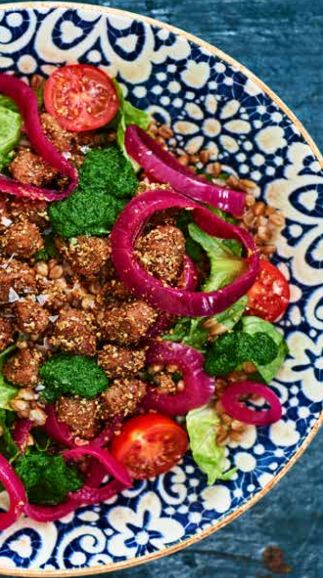
Dinkelbowl med grönkålsdressing, solrosfrönuggets, råstekt sparris och picklad rödlök.