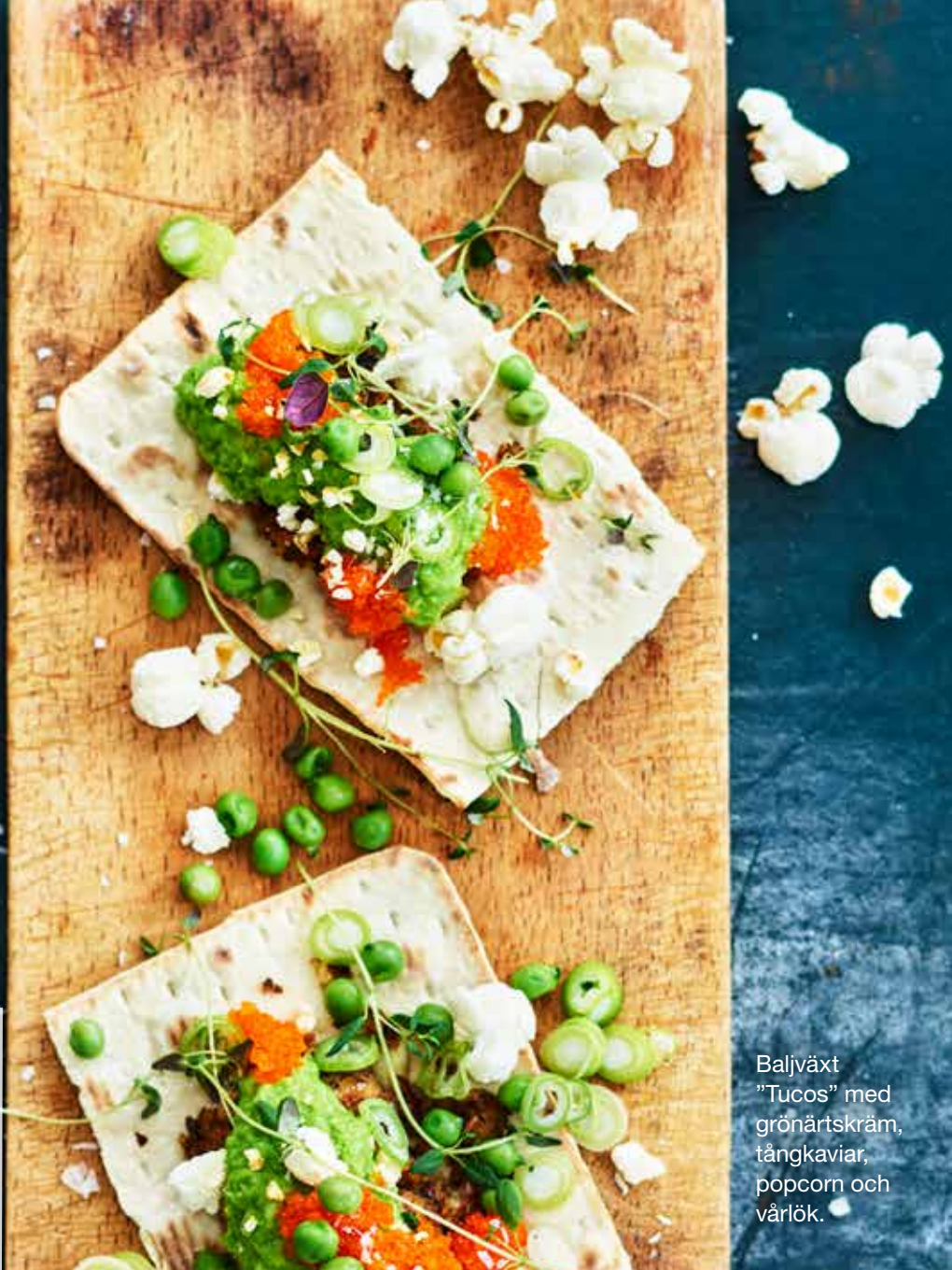
Baljväxt ”Tucos” med grönärtskräm, fångkaviar, popcorn och vårlök.

– Växtbaserat har gått från att vara undantag till att bli regel. Min rekommendation är att om man saknar kunskap om växtbaserat så är det klokt att utbilda sig nu, för det kommer att behövas.